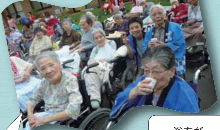
お祭り、 元気が出るよ。