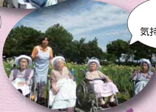
青空が 気持ちいい~。