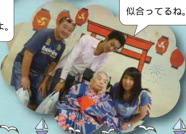
浴衣が 似合ってるね。